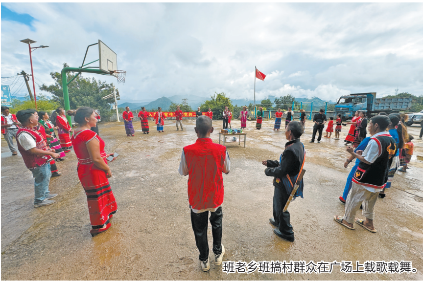
班老乡班搞村群众在广场上载歌载舞。